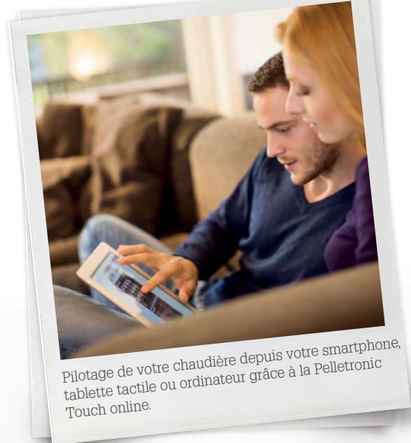
Pilotage de votre chaudière depuis votre smartphone, tablette tactile ou ordinateur grâce à la Pelletronic Touch online.

Chaudière à granulés à condensation très haute performance, intégrée et multifonction, la Pellematic Smart XS offre des qualités uniques sur le marché de la chaudière à granulés de bois : puissances à partir de 3 kW seulement et jusqu'à 18 kW, et rendement supérieur à 100 % ! Chaufferie complète et combinée, elle apporte l'ensemble des services dont vous avez besoin, pour un encombrement minimum.